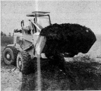
Vom 30. 4. bis 9. 5. 1961 findet in Hannover die diesjährige Deutsche Industrie-Messe statt.